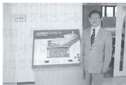
●ゴミ処理施設北しりべつ広域クリーンセンターを視察・研究致しました。