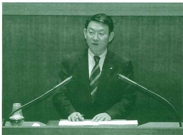
●6月 館林市議会にて一般質問