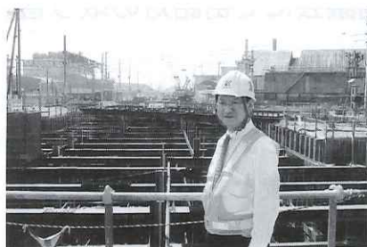
●建設環境副委員長として西部1号線立体交差現場を視察・調査致しました。