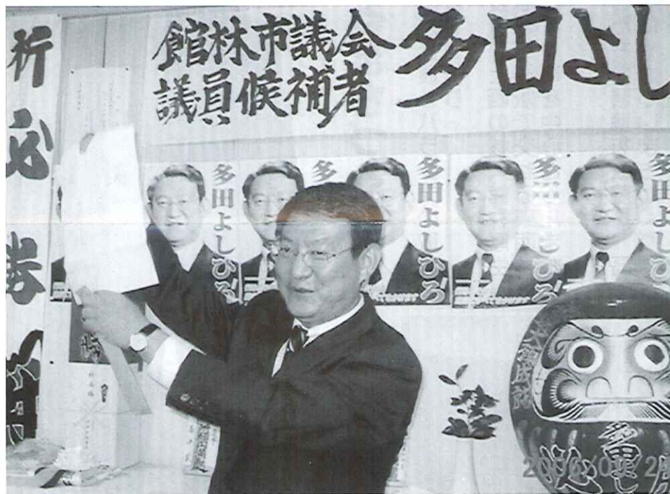
●お陰様で選管より当選招書を頂きました。