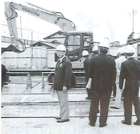
●建設環境副委員長として西部1号線立体交差現場を視察・調査致しました。

夢や目標に向けて日々「どう」かという意図だるう（目的意識）「なぜ」かという意図（問題意識）「どうすればよいか」改善意識」という視点から考察行動していれば、必ず願いは叶うと信じています。