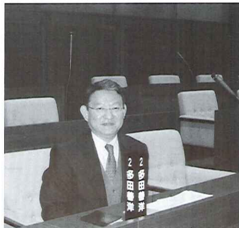
●議会にて席が決まりました。2番です。