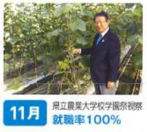
11月 県立農業大学校学歴視察 就職率100%