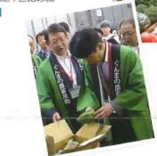
10月 県立 蚕糸技術 センター視察 産繰りの体験