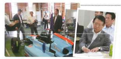
7月 外国人との共生に関する特別委員会 中日本自動車大学など視察 日本語弁論大会も行われます