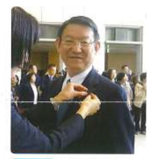
4月 県議二期目初登壇 初心忘るべからず