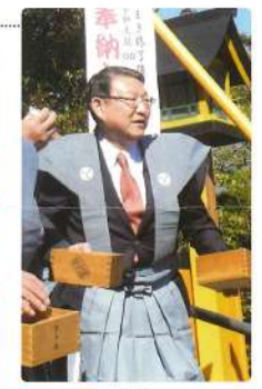
3月 館林駅西口広場完成 駅東西連絡通路の検討会議 会長を務めたので 感慨無量です