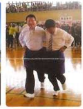
11月 デカパン リレー