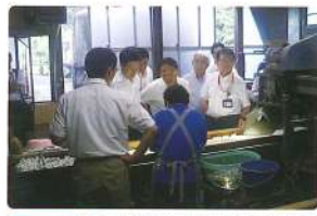
8月 農林環境常任委員会雄水製氷製氷場視察 国内製氷の6割生産 群馬の宝