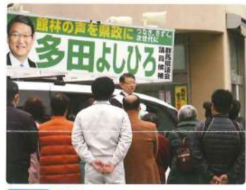
3月 県議選 街頭で政策を訴える