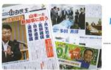
11月 議員活動を報告する