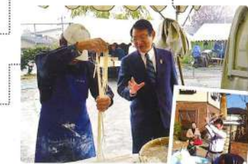
11月 公民館 祭りは楽しい