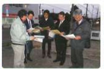
11月 街路事業現地視察 県の担当部局と 現場で考える