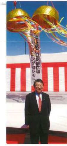
2月 節分祭 皆さんの幸せを祈る