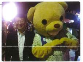
10月 ハロウィン は雨にも負けず