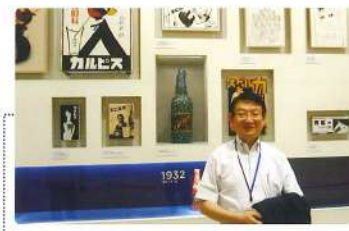
7月 カルビスみらいの ミュージアム見学 カルビスができて 100年