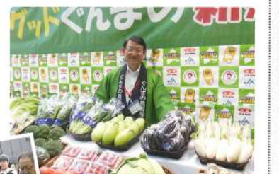
10月 大田市場で 県産野菜販売促進 どれも新鮮！ 群馬の野菜は人気高し