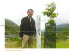
6月 フィールドワーク植樹 足尾の山に緑を