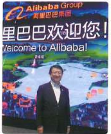
11月 群馬県議会商工議員連盟 上海市 杭州市 県内企業現地視察