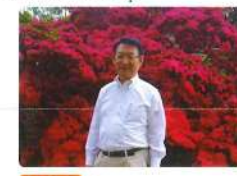
5月 満開のツツジと