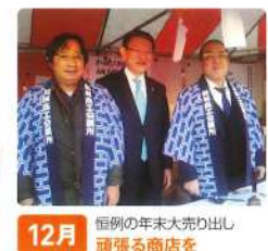
12月 恒例の年末大売り出し 頑張る商店を 応援しなければ