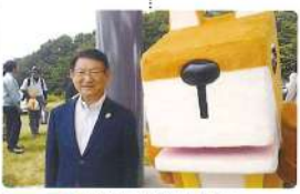
8月 山の日記念21世紀の森 毎年参加