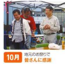
10月 地元のお祭り 皆さんに感謝