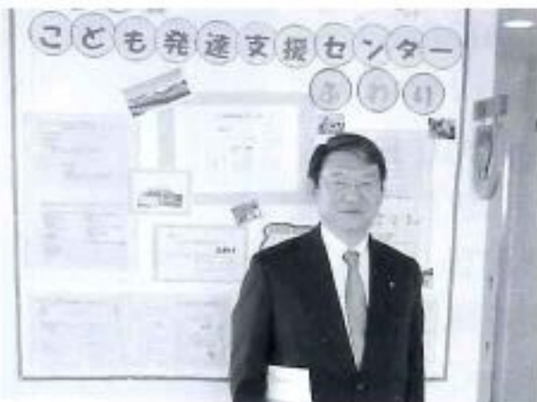
島田市子ども発達支援センター視察