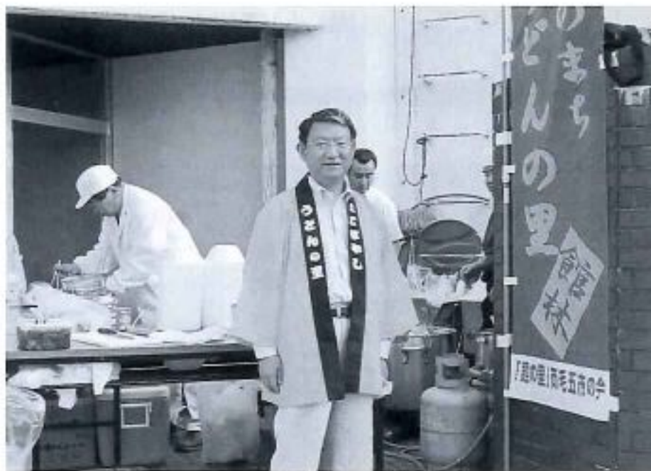
宮城県山元町被災地での炊き出し支援

今後ともより一層のご指導、ご鞭撻を賜りますようお願い申し上、今年一年が皆様にとって実り多き年であります様ご祈念致します。