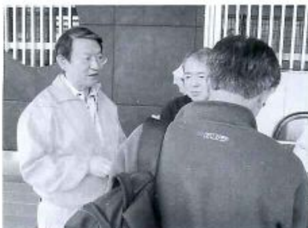
館林駅にてまちなか散策ガイド配布