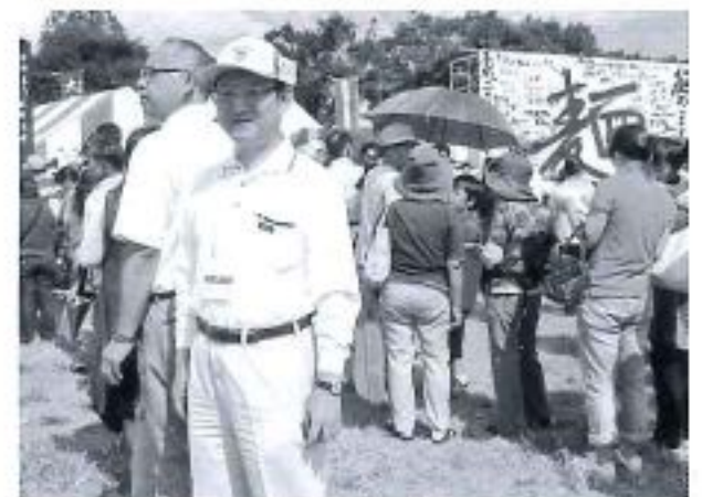
趣-1グランプリin館林ボランティア協力