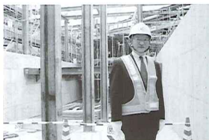
●もうすぐ開通します。西部1号線立体交差事業現場を視察・調査致しました。