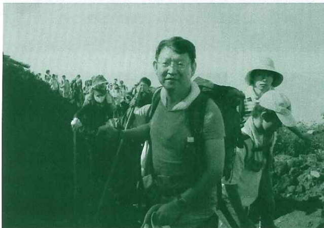
●2008年8月 富士山頂登山

今後ともより一層のご指導ご鞭撻を賜りますようお願い申し上げます。今年一年が皆様にとって実り多き年であります様ご祈念いたします。