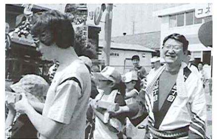
●地元夏祭りに参加して。